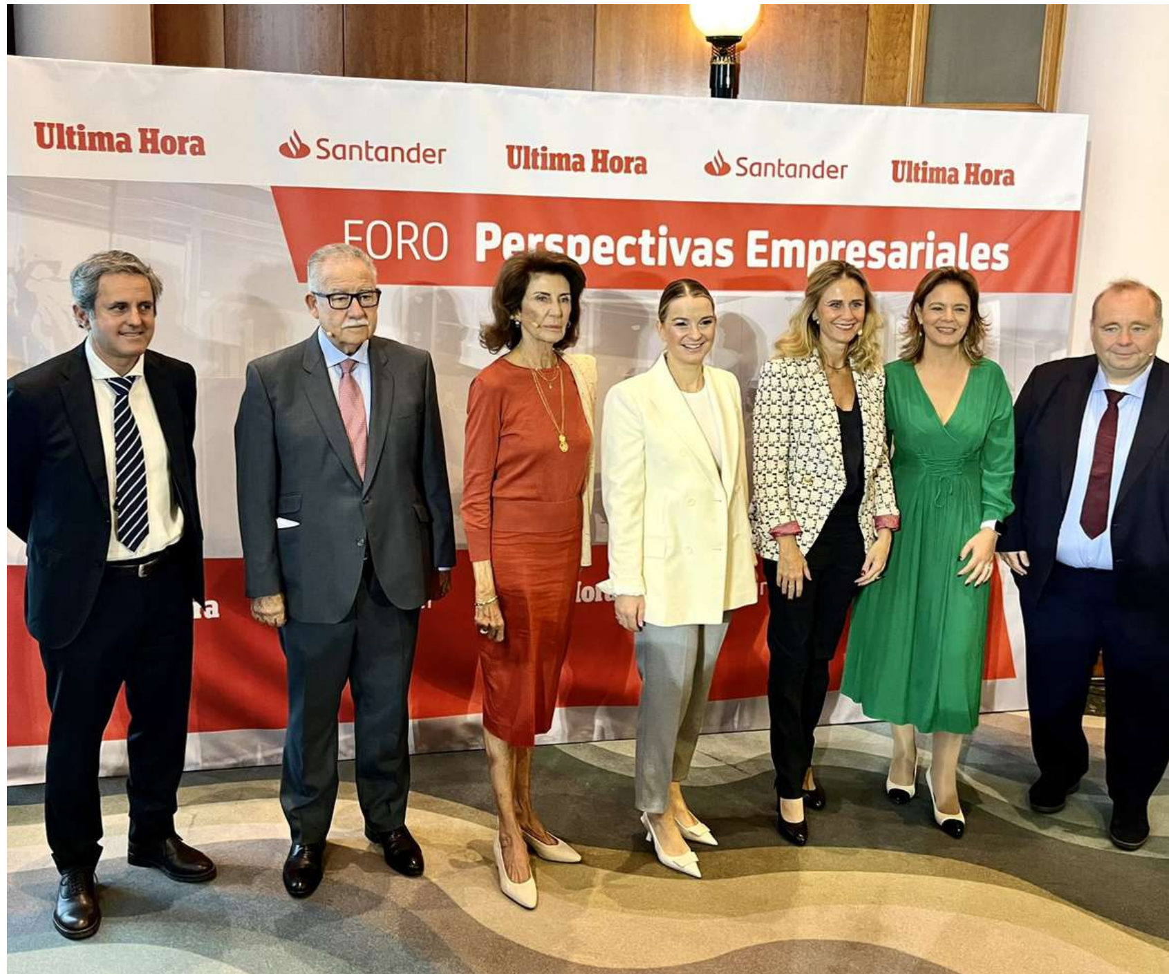
Foro Perspectivas Empresariales