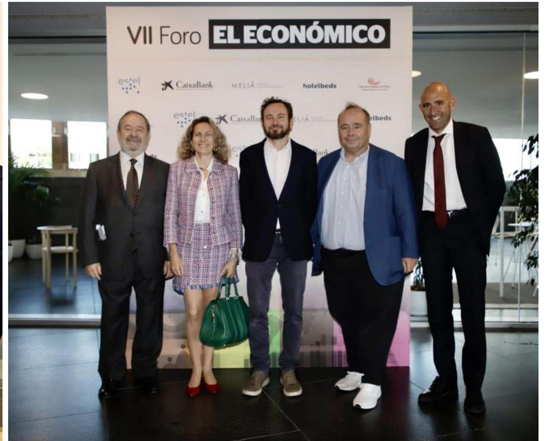
VII Foro de El Económico