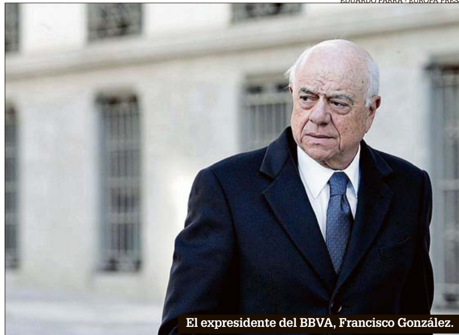
El expresidente del BBVA, Francisco González.