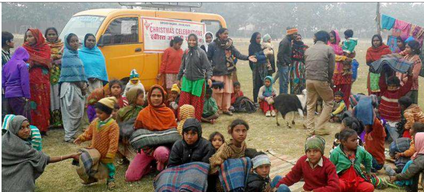
Durante la pasada Navidad, DARE Home repartió mantas entre las familias del 'slum' de la estación del tren de Sarnath.

encuentro ninguno de los veinticinco niños con los que arranca este nuevo programa de alfabetización y alimentación. Es difícil no emocionarse ante la presencia de esos pequeños, sentados en orden y con los ojos muy abiertos, desconcertados por la presencia de unos desconocidos dispuestos a enseñarles a leer y escribir, pero ávidos por aprender, allí, en un rincón del 'slum' que de pronto parece mucho más que eso.